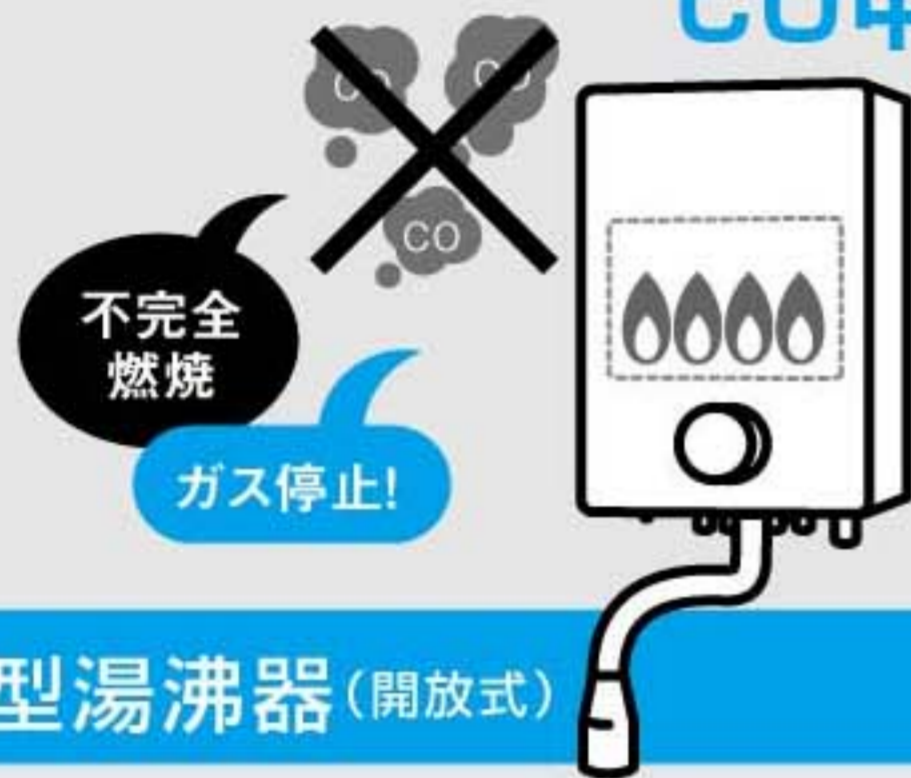
小型湯沸器(開放式)