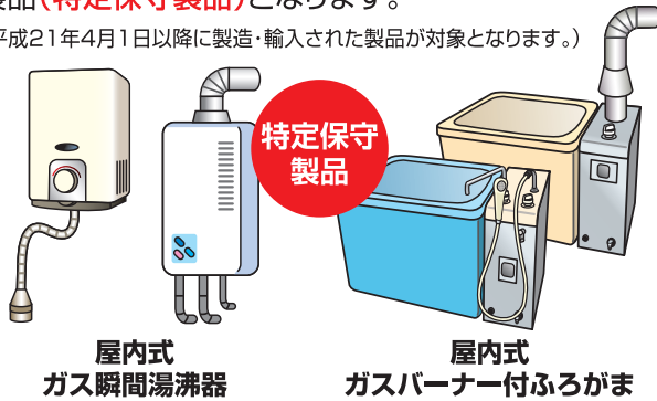
屋内式 ガス瞬間湯沸器