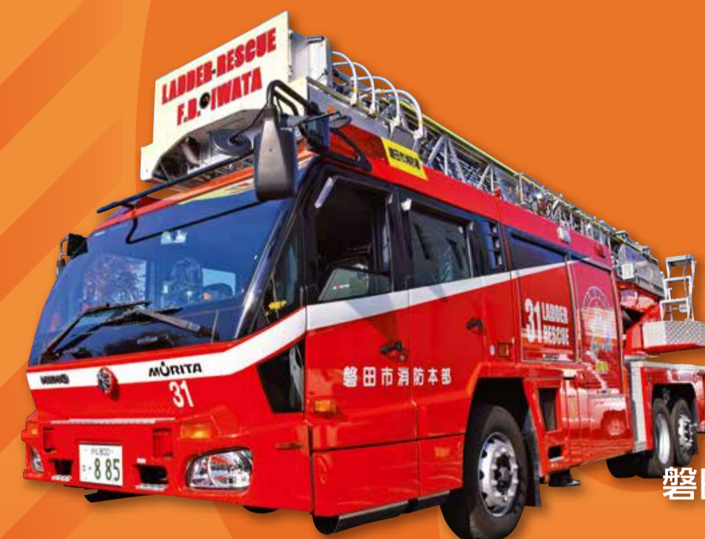
磐田市消防本部 (はしご車)