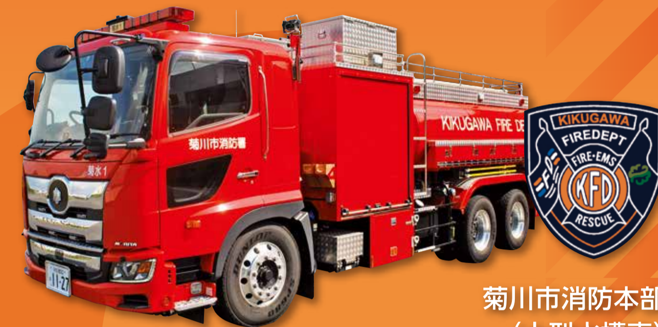
菊川市消防本部 (大型水槽車)