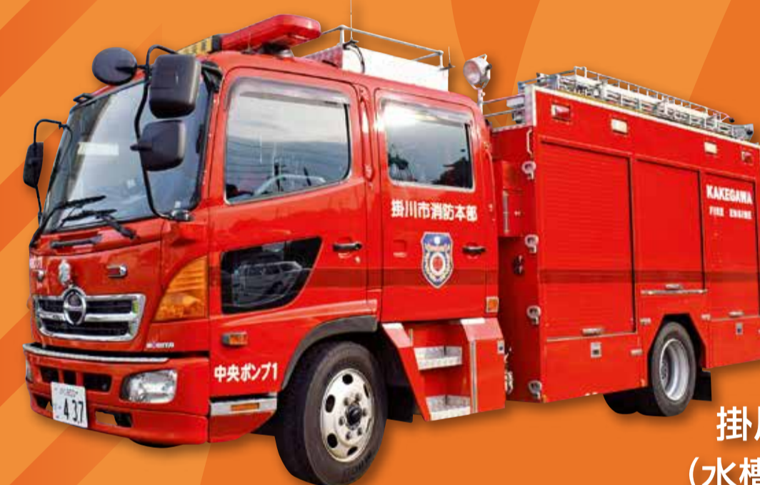
掛川市消防本部 (水槽付ポンプ車)