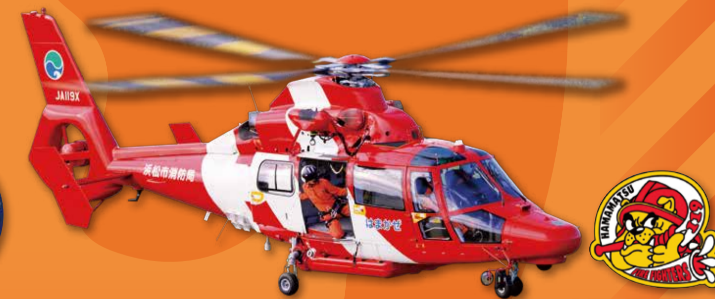
浜松市消防局 (消防ヘリコプター「はまかせ」)