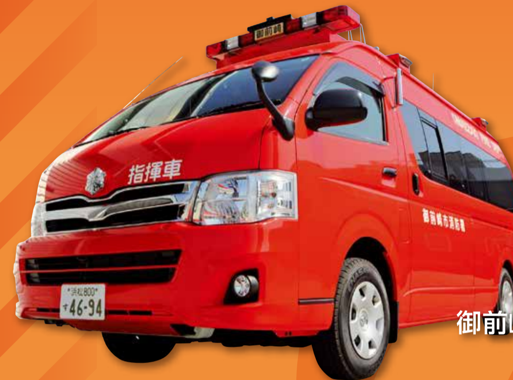
御前崎市消防本部 (指揮車)