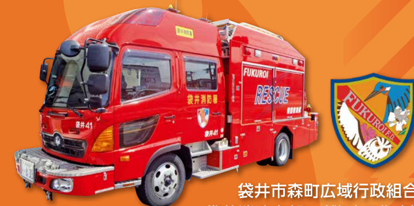
袋井市森町広域行政組合 袋井消防本部 (救助工作車)