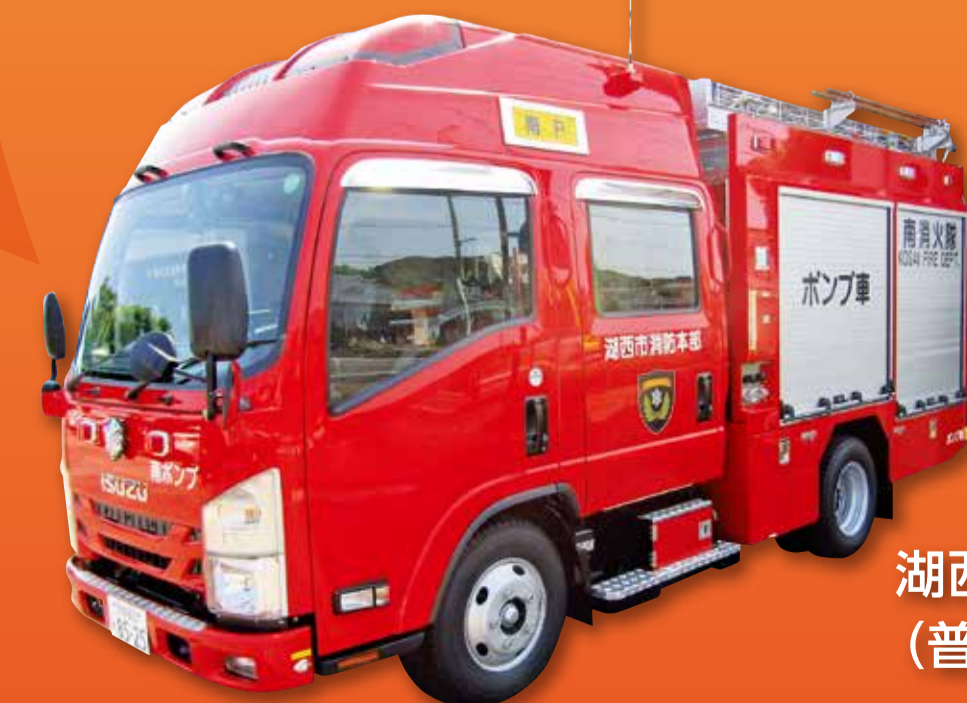
湖西市消防本部 (普通ポンプ車)